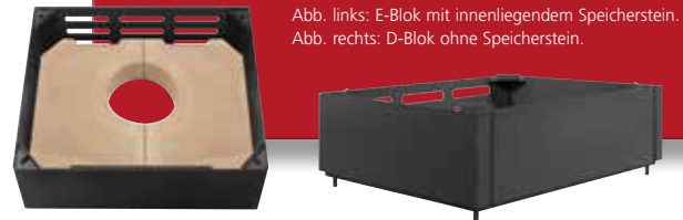
Abb. links: E-Blok mit innenliegendem Speicherstein. Abb. rechts: D-Blok ohne Speicherstein.

Um bis zu 3 zusätzliche Segmente (E-Blok oder D-Blok) erweiterbar. Höhe: 147 mm je E-Blok